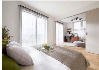
「LATO(引戸付き)」当社施工例