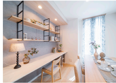
「ファミリーコーナー」当社施工例