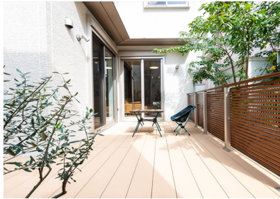
「ウッドデッキ」当社施工例

1階床面積 / 47.93㎡ 2階床面積 / 47.93㎡ 小屋裏収納 / 7.24㎡